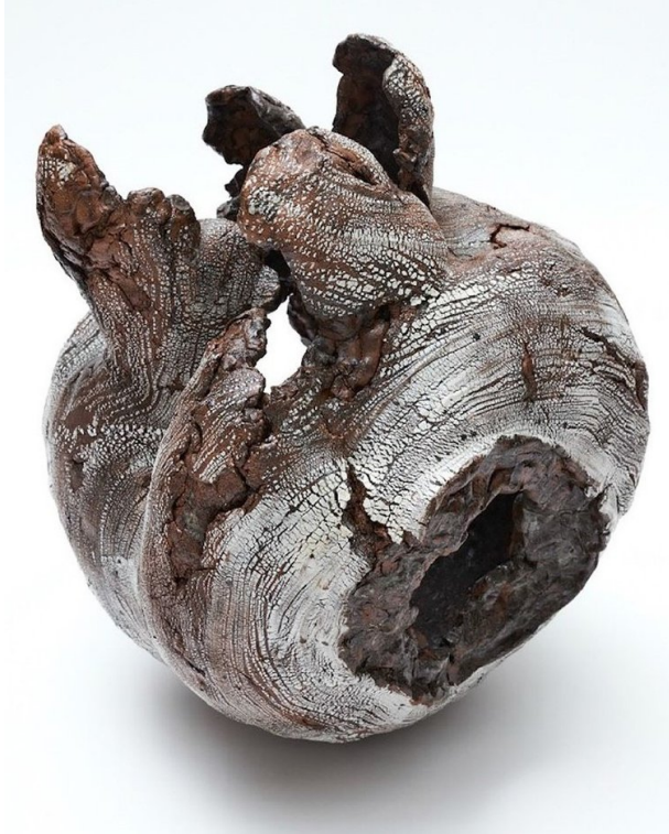
Yoshimi Futamura, Rebirth (YF No. 2) , 2023, grès et porcelaine, 45 x 32 x 41 cm.

Avec la photographie, la peinture occupe parallèlement une place importante. Valérie Delaunay (Paris) réunit un majestueux retable de Thibaut Huchard aux côtés d'œuvres de Dayane Obadia et de Sergio Morabito. Nouvelle venue dans la section, Grège Gallery (Bruxelles) présente les huiles épurées de Chidy Wayne et Juliette Lemontey, toutes deux centrées sur la figure humaine. Les galeries invitées peuvent y présenter jusqu'à trois artistes, favorisant des projets resserrés où chaque proposition gagne en lisibilité.