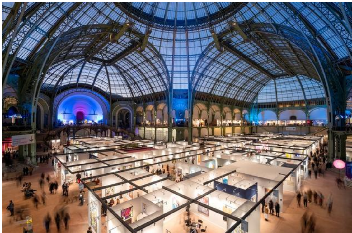
Art Paris 2025 au Grand Palais.

Le lundi 30 septembre, le comité de sélection de la foire a retenu une première sélection, sur un total plus de 170 exposants prévus pour l'édition d'avril 2026, dont de nouveaux participants étrangers.