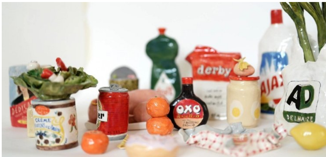
Philippine d'Otreppe, Boucan , 2024, peinture, sculpture. EDJI Gallery