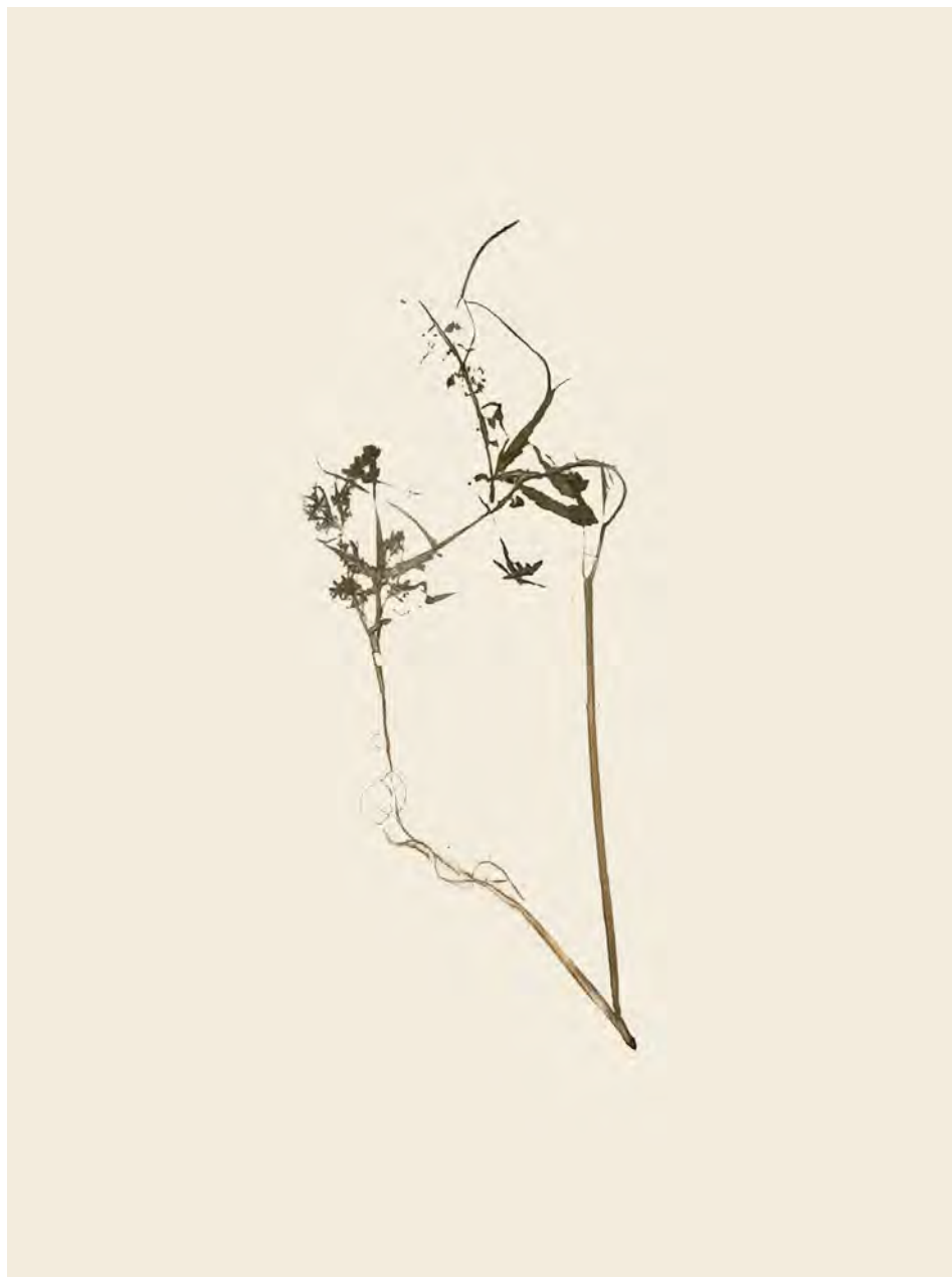
potential hemp (from the Mountain ledges) Oil on canvas 120 cm x 90 cm AV-2022-U-265 5 800,00 €