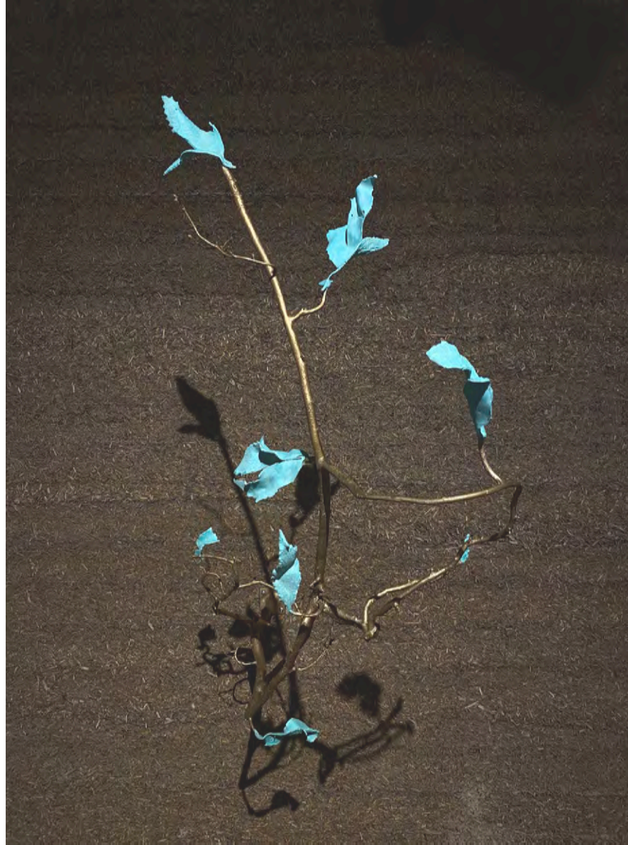
second tree prosthesis (forms derived from hemp) Bronze sculpture, old gold and green patina 108 cm x 50 cm x 40 cm AV-2022-U-257