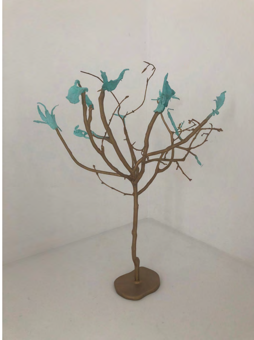
element/tr33 Bronze sculpture, green and old gold patina 50 cm x 40 cm x 40 cm AV-2022-U-259 13 000 euros