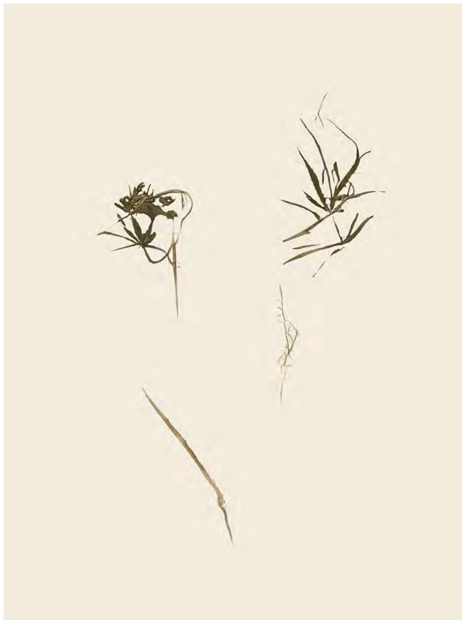
impossible hemp samples, 2022 Oil on canvas 150 cm x 120 cm AV-2022-U-263 6 500,00 €