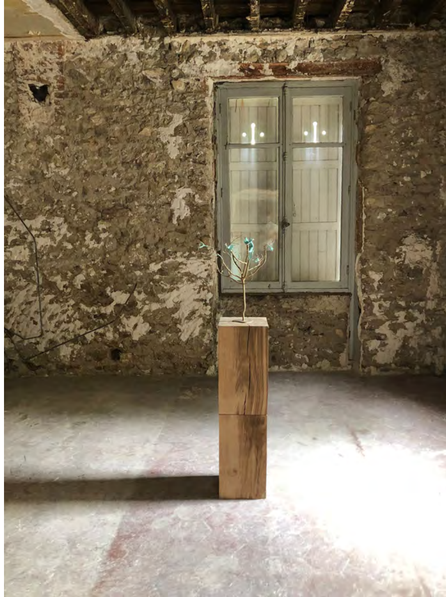
Installation view at 91530 Le Marais element/tr33