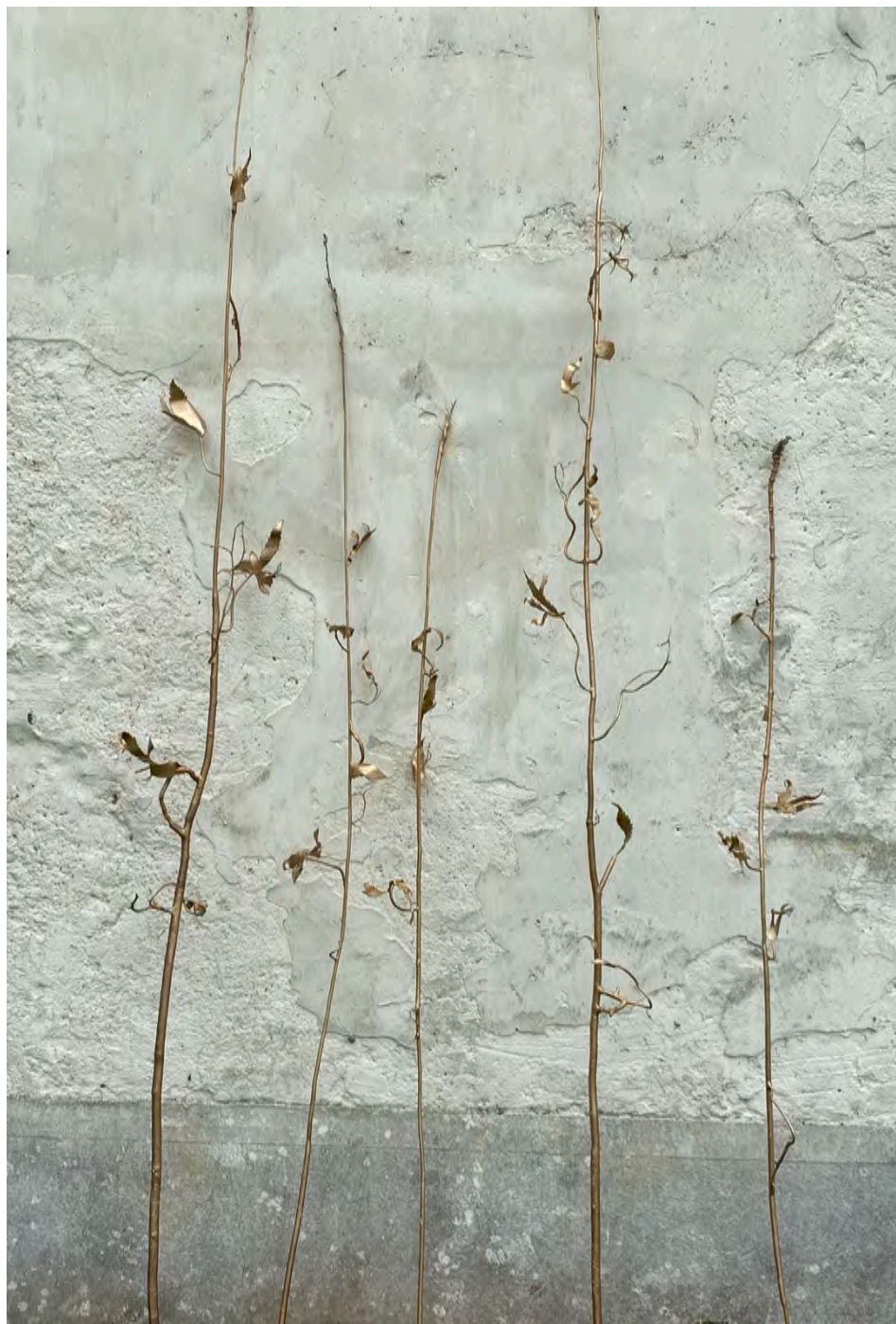
bitter-hemp Bronze sculptures, old gold patina Variable dimensions AV-2022-U-251 AV-2022-U-252 AV-2022-U-253 AV-2022-U-254 AV-2022-U-255